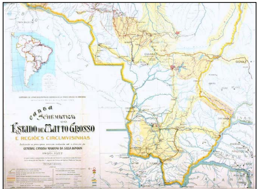
Carta Esquemática do Estado de Mato Grosso, publicada em 1922.