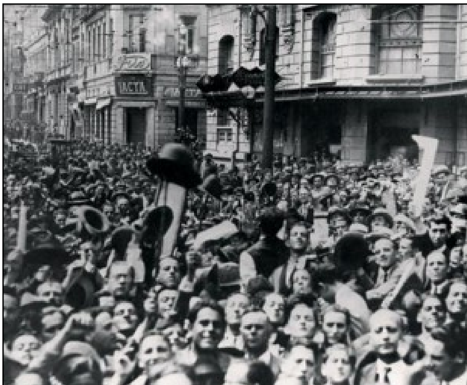
Revolução de 30.

funcionavam escolas para índios, entre outros. Considero que esta carta tenha funcionado como grande propagandista dos feitos comissão.