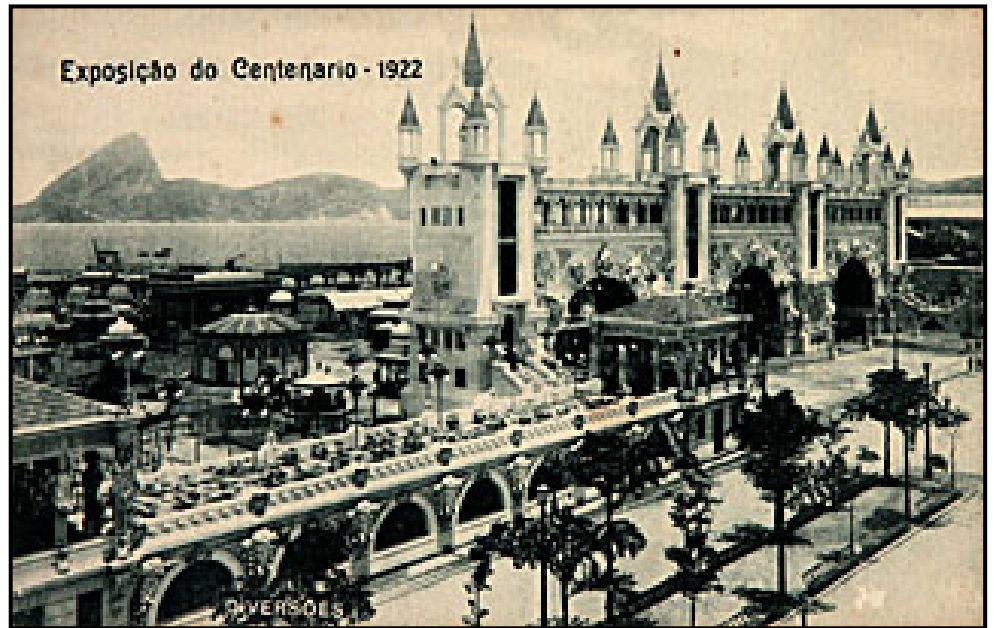
Comemoração do Primeiro Centenário da Independência do Brasil - Cartão Postal Diversões.